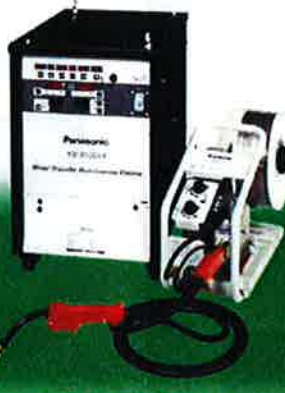
YD-350GV4 CO 2 /MAG