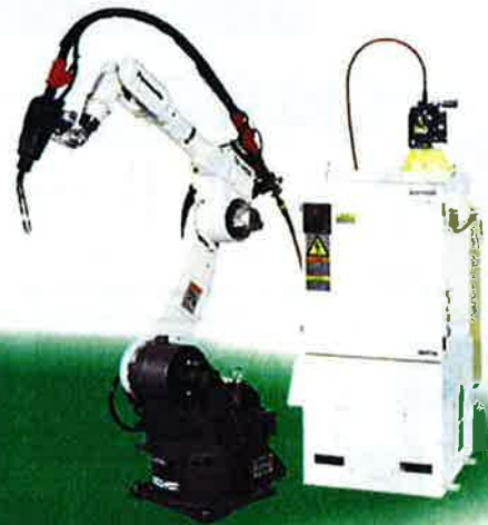
The Arc Welding Robot System ActiveTAWERS