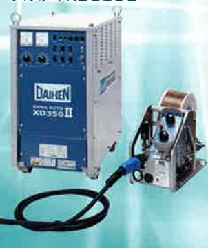
サイリスタ制御式CO 2 /MAG溶接機 ダイナオードXD350 II