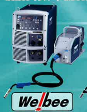
CO 2 /MAG自動溶接機 Welbee インバータ M350L